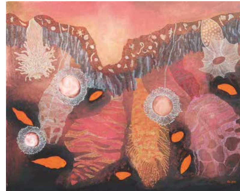
Versunkenes Land, Öl auf Leinwand, 80 x 100 cm, 2020