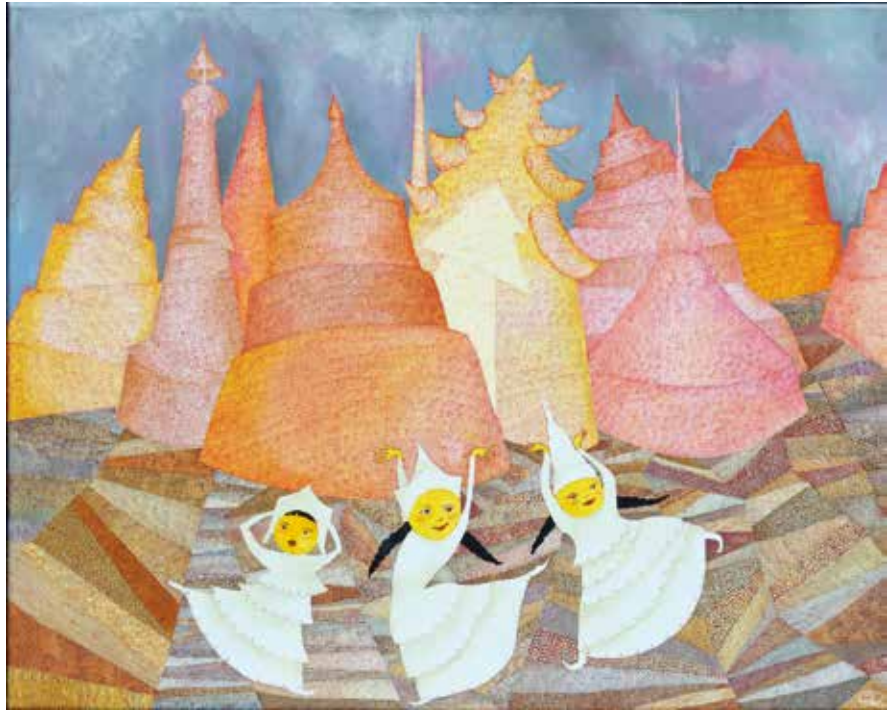
Tanzende Tempelkinder, Öl auf Leinwand, 80 x 100 cm, 2022 Flatterndes Herz, Öl auf Leinwand, 60 x 90 cm, 2021