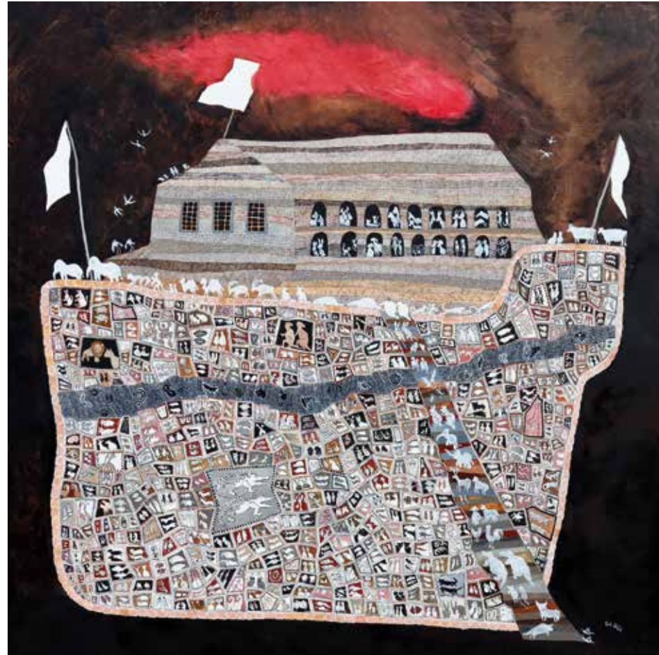
Arche, Öl auf Leinwand, 100 x 100 cm, 2022