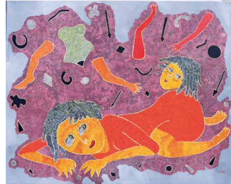
Auf sich selbst zurückgeworfen, Öl auf Leinwand, 80 x 100 cm, 2022