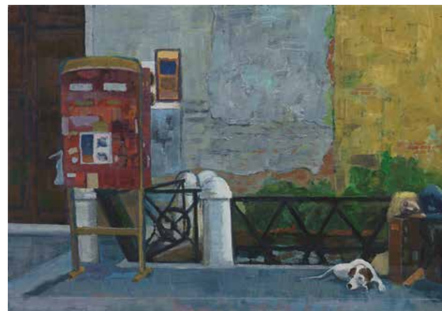
Am Abend 2019 Am Kanal 2019