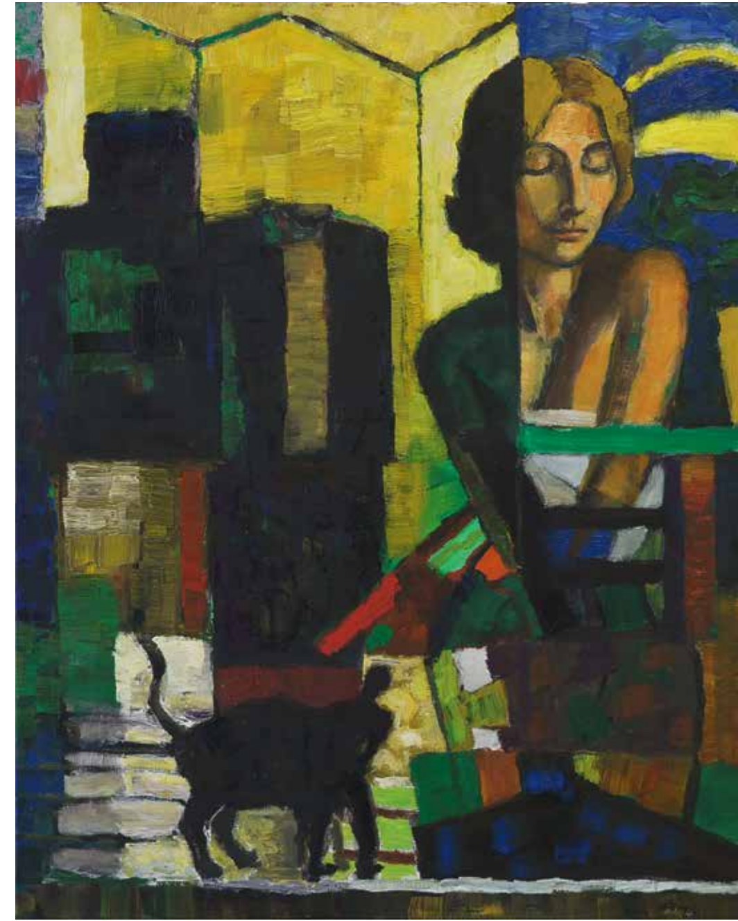
o. T. 2020 Obststand 2019