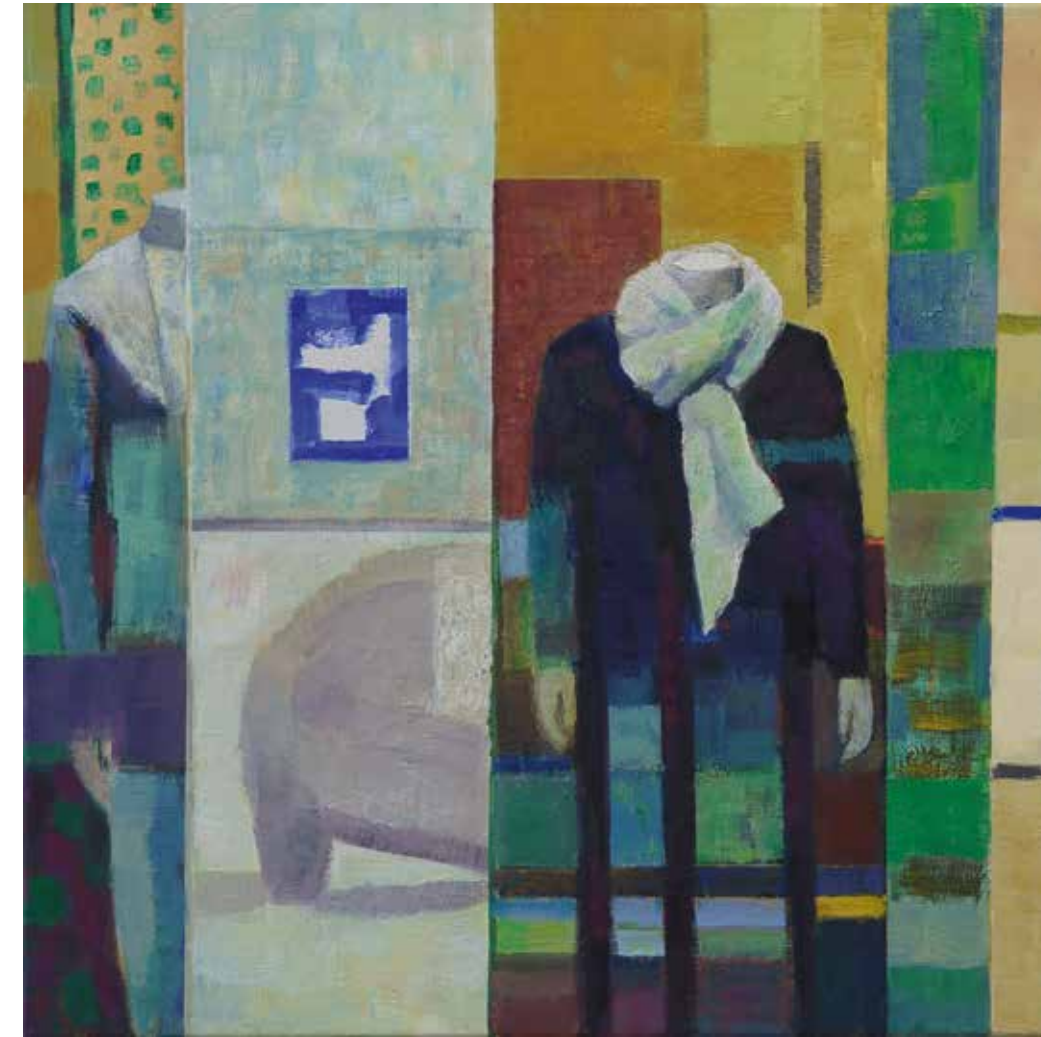
Der zerbrochene Steg 2020 Herthasee 2020 Venez. Bettlerin 2018 Schaufenster 2020