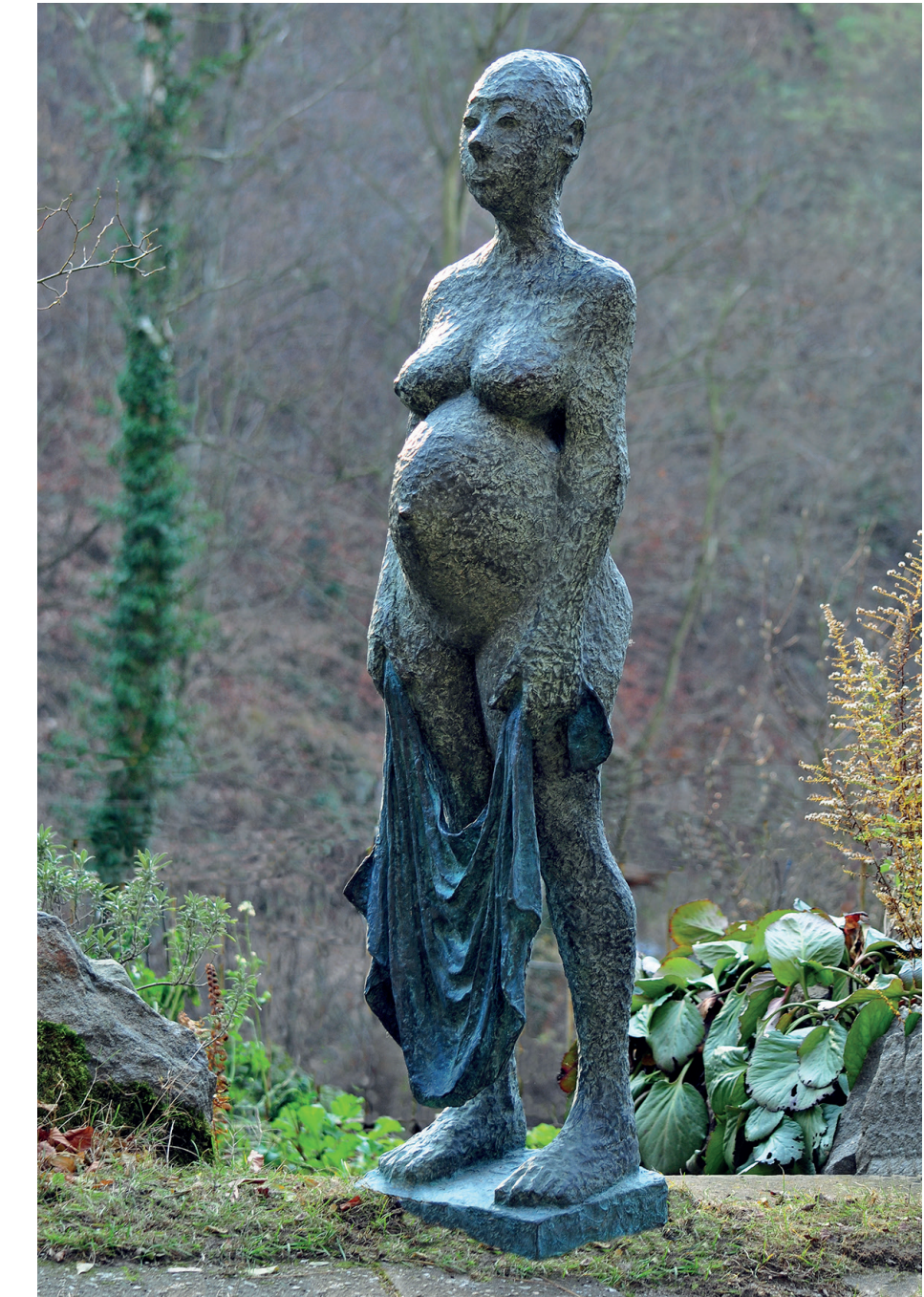
Große Schwangere, Höhe 152 cm, 2020