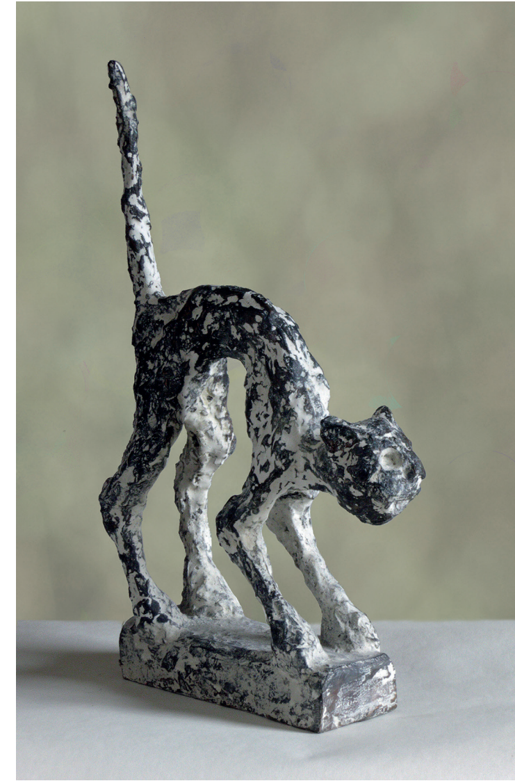
Vor dem Angriff, Höhe 11,5 cm, 2015