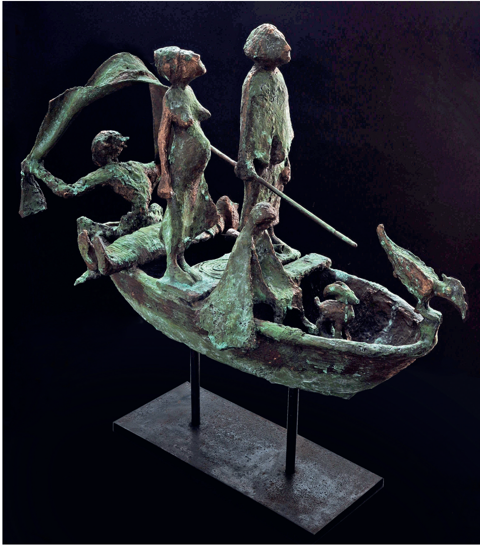
Charons Nachen, Höhe 46 cm, 2008