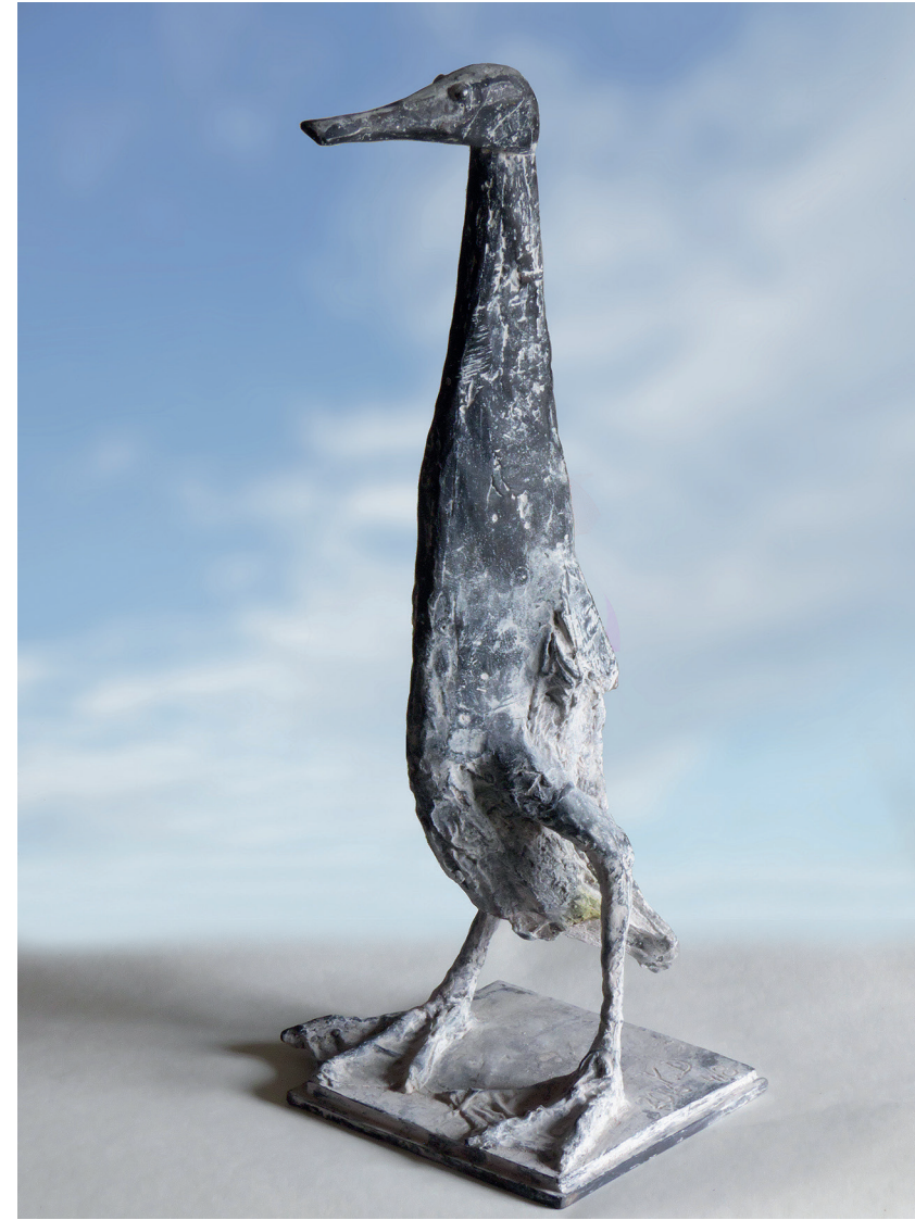
Wächter, Höhe 37 cm, 2016