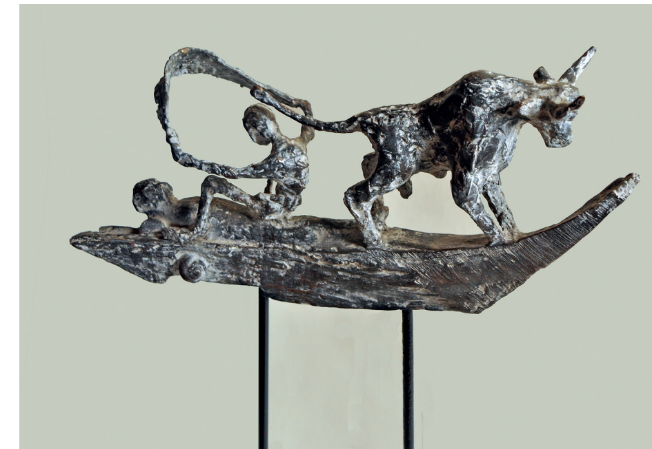
Die letzte Fähre, Höhe 47 cm, 2014

Arbeiten befinden sich im Besitz von Museen in Altenburg, Berlin, Chemnitz, Dresden, Düsseldorf, Cottbus, Frankfurt / Oder, Halle, Leipzig, Marbach (Deutsches Literatur Archiv), Salzgitter, Pirna, Rostock, Schwerin, Senftenberg, Havelberg, Neubrandenburg, Zittau u. a. sowie in öffentlichen Einrichtungen, z.B. der Stadt Dresden, des Freistaates Sachsen, der Sächsischen Landesbibliothek Dresden, des Kreiskrankenhauses Pirna und in Privatsammlungen