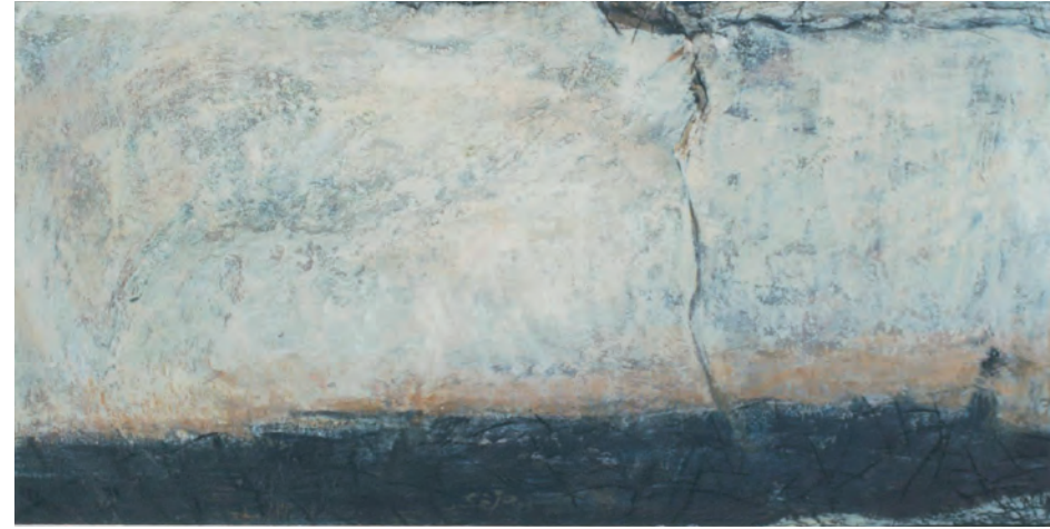
Der Berg, Acryl / Öl, 120 x 100 cm