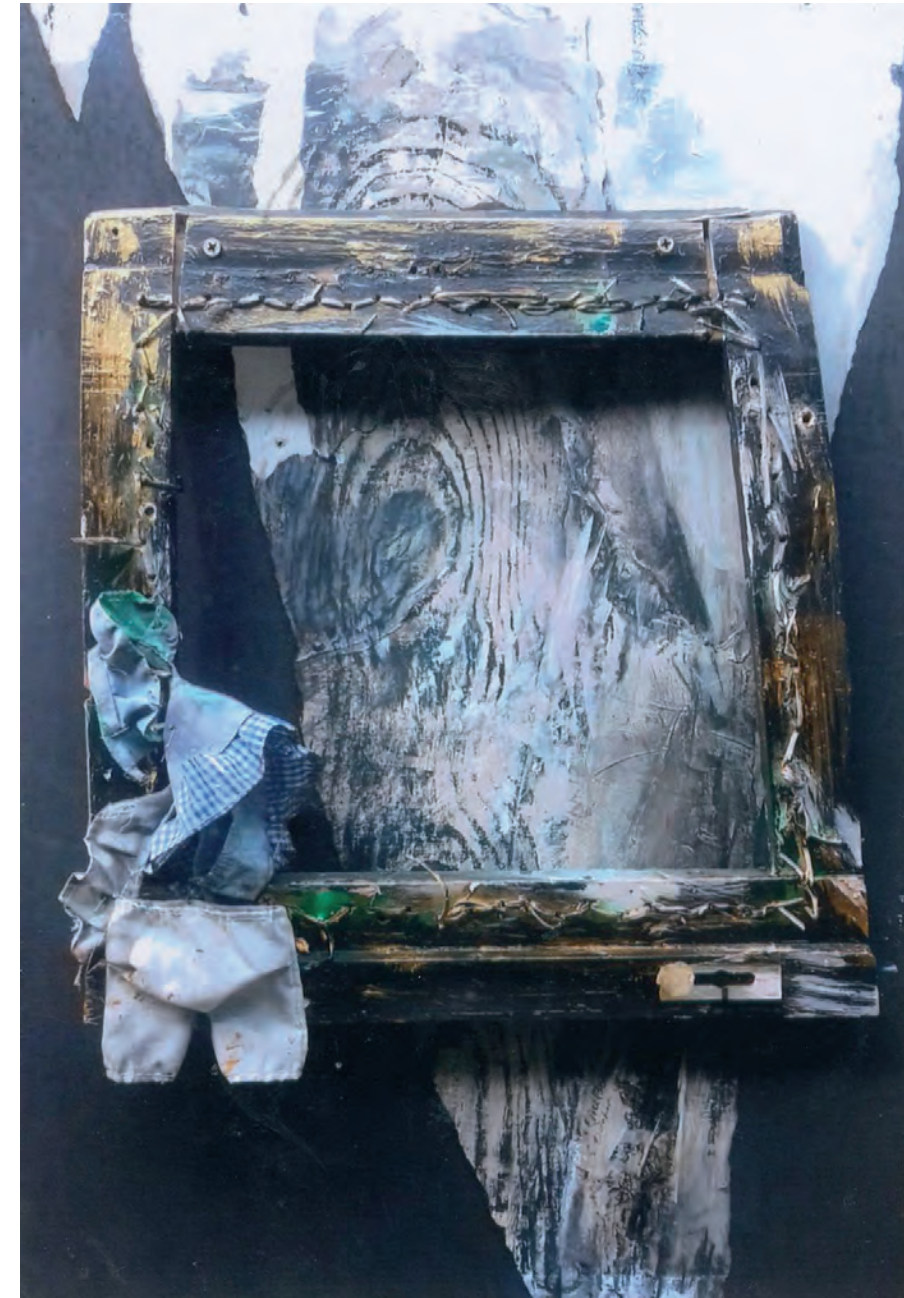
Objekt Stuhl, 70 x 50 cm