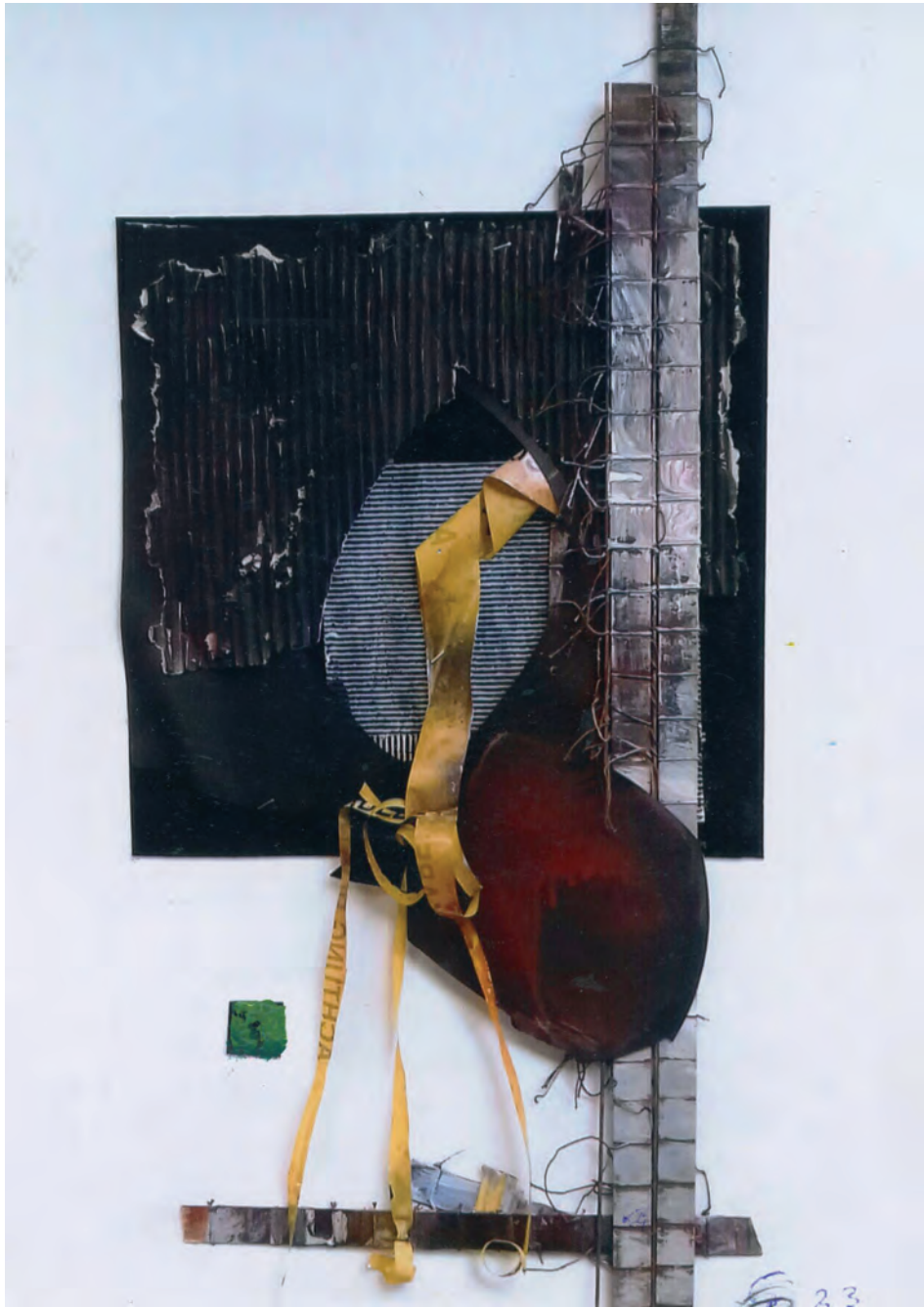
Prometheus, Collage, 90 x 70 cm