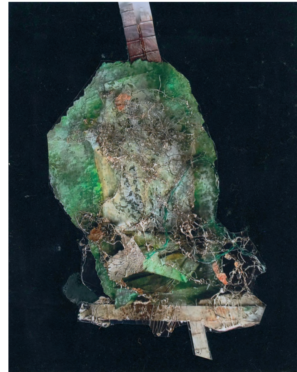
Albtraum, 3 Collagen, 90 x 70 cm