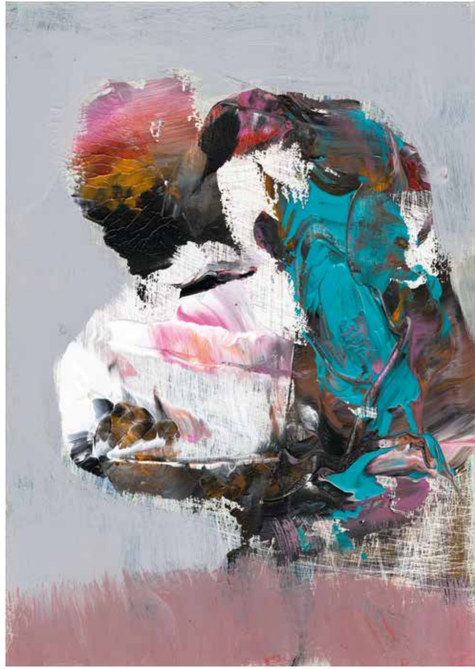
A lost man recalls a moment when he was treated well by a stranger