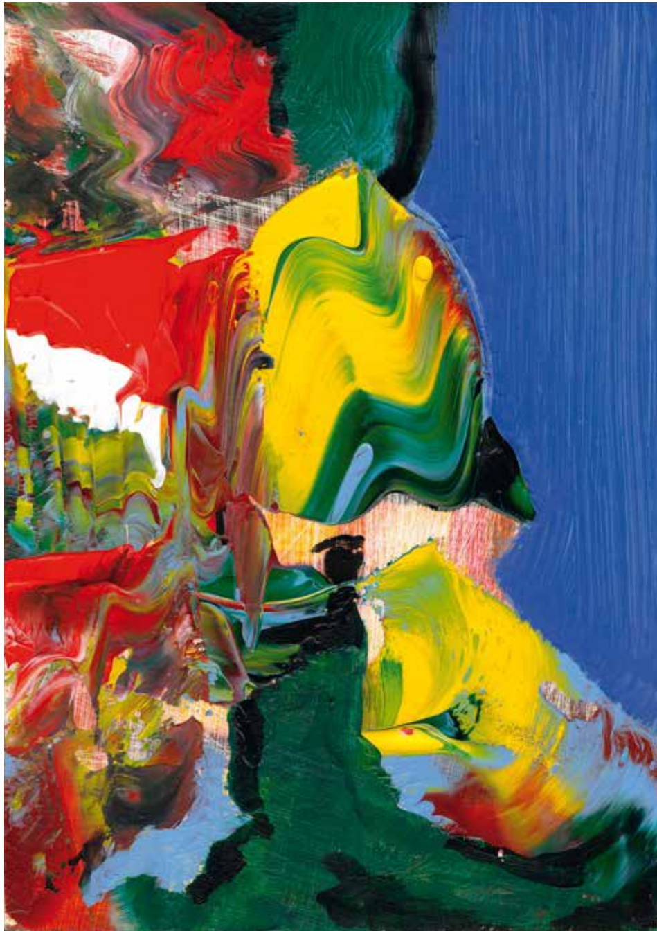
The interior of a glass marble mapped